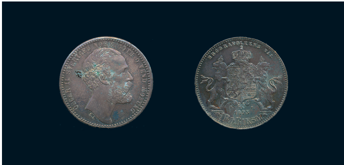
805 * Oskar II. Riksdaler riksmünt 1873. SM 41. 1+ ojämn patina, fläckar, liten kantskada. 1.000