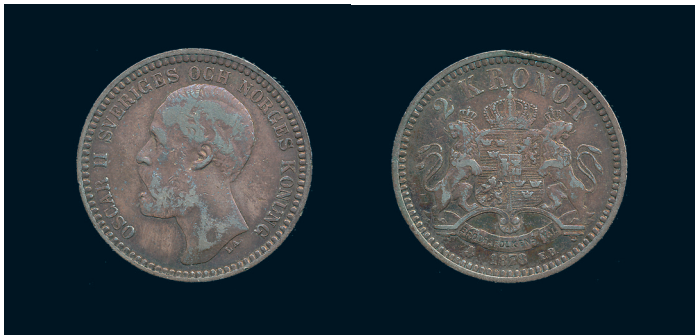
807 * Oskar II. 2 kronor 1878 med OCH. SM 47. 1? ojäm patina, kantskada. 700