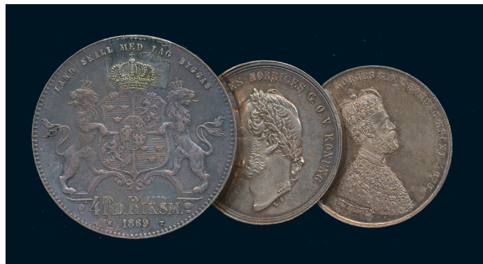
817 * 4 rdr rm 1869 1/1+ ojäm patina, "kastmynt" 1859 1+ och 1873 1+/01. 600