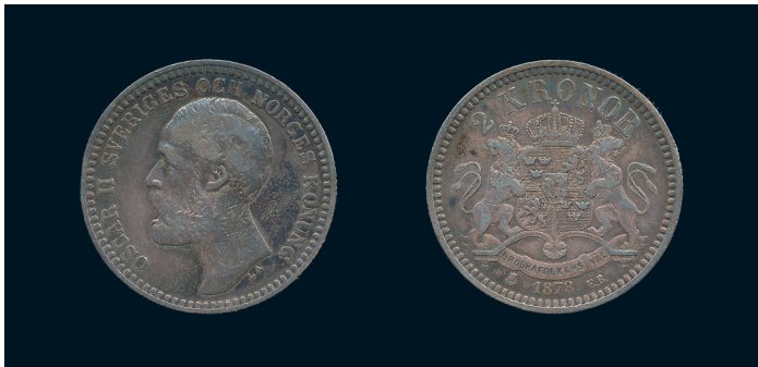
806 * Oskar II. 2 kronor 1878 med OCH. SM 47. 1? ojäm patina. 1.000