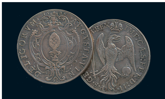
831 * Germany. Augsburg. Box thaler 1626 (empty). Dav 5021. F-VF cleaned. 500