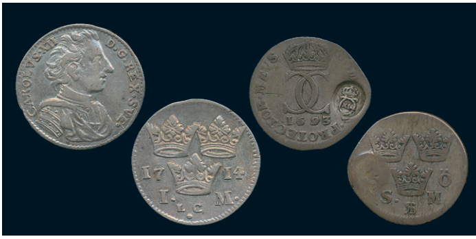
902 * Karl XII. Mark 1714. SM 96. 1)/(1/1+. 600 903 * Karl XII. 5 öre 1693, kontramarkerad med Karl XII.s monogram under Rigas belägring 1705. SB 114. 1/1+ repor. 500