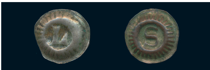
877 * Magnus Eriksson 1319-63. Lödöse. Brakteat med L. LL XXV:2a. Frösell -. 0,51 g. 1/1+. 500