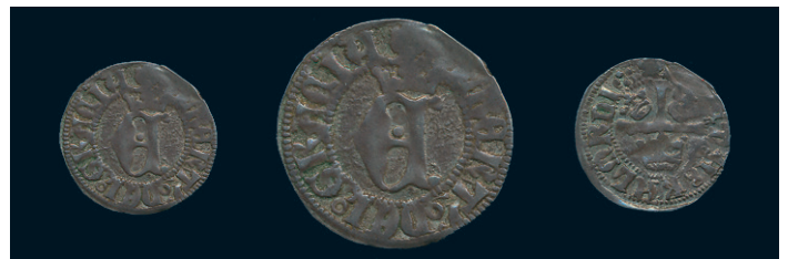
880 * Albrekt av Mecklenburg. Örtug Kalmar. LL 5a. Frösell -. 1,26 g. R. 1/1+. 2.000