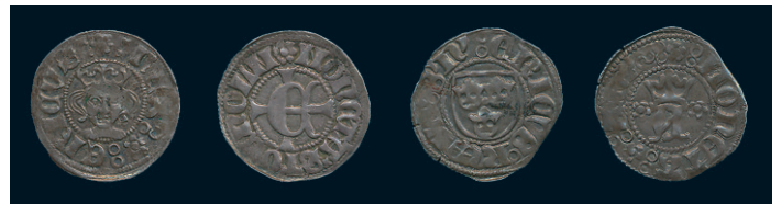
882 * Erik av Pommern 1396-1439. Örtug Stockholm. LL 1a. 1,19 g. 1/1+. 700