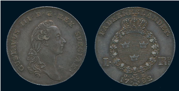
904 * Gustav III. Riksdaler 1782. SM 48. 1/1+. 500