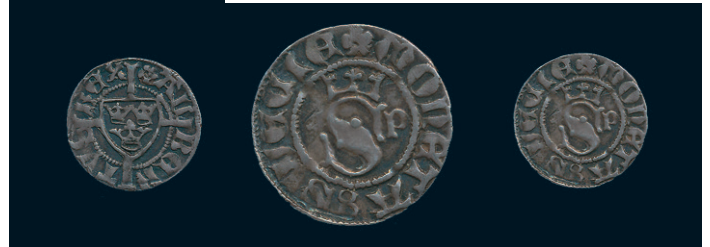
881 * Albrekt av Mecklenburg. Örtug Söderköping. LL 10a. 1,50 g. 1/1+. 1.500