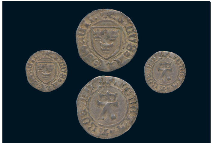
884 * Erik av Pommern. Örtug Åbo. LL 8b. 1,07 g. R. 1. 5.000