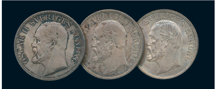
924 * Oskar II. 2 kronor 1906 (2) och 1907. SM 59-60. 1+/01-01 patina. 1.000