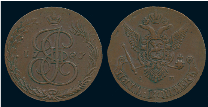
905 * Gustav III. 5 kopek 1787/77, att användas under kriget mot Ryssland 1788-90. SM 108b. Tilltalande ex 1/1+. 10.000