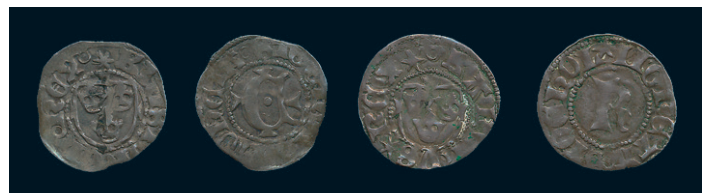
885 * Kristoffer av Bayern 1441-48. Örtug Stockholm. LL 2a. Frösell -. 1,14 g. R. 1/1+. 1.000