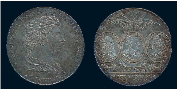
906 * Karl XIV Johan. Riksdaler 1821 jubileum. SM 43. Bra ex 1+/01 plantsfel på randen. 2.000 907 Oskar II. 20 kronor 1878/7. SM 8b. 1+ små hack. 1.400 908 Oskar II. 10 kronor 1874/3. SM 25b. 1+/01. 750 909 Oskar II. 10 kronor 1874/3. SM 25b. 1+/01. 750 910 Oskar II. 10 kronor 1874. SM 25a. 1+/01. 750 911 Oskar II. 10 kronor 1874. SM 25a. 1+. 700 912 Oskar II. 10 kronor 1883. SM 30a. 1/1+. 700 913 Oskar II. 10 kronor 1895. SM 32. 1+/01. 750 914 Oskar II. 10 kronor 1901. SM 33. 01. 750