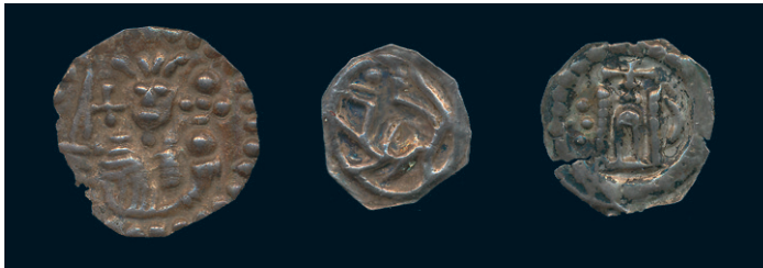
871 * Knut Eriksson 1167-96. Svealand. Brakteat med kungabild. LL I:A:5a. Frösell -. 0,28 g. R. 1/1+ kantskador. 1.500