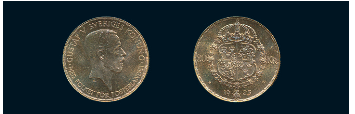
925 * Gustav V. 20 kronor 1925. SM 1. 1+/01. 5.000 926 Gustav V. 5 kronor 1920. SM 2. 01. 400 927 Gustav V. 5 kronor 1920. SM 2. 1+/01. 400 928 Gustav V. 5 kronor 1920. SM 2. 1+. 350