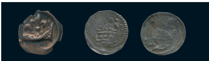
874 * Erik Eriksson. Götaland. Brakteat med krona. LL XVI:1. 0,14 g. 1/1+ kantskador. 1.000