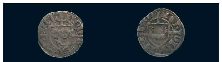
887 * Karl Knutsson Bonde. Örtug Stockholm. LL 3b. 1,27 g. 1. 700