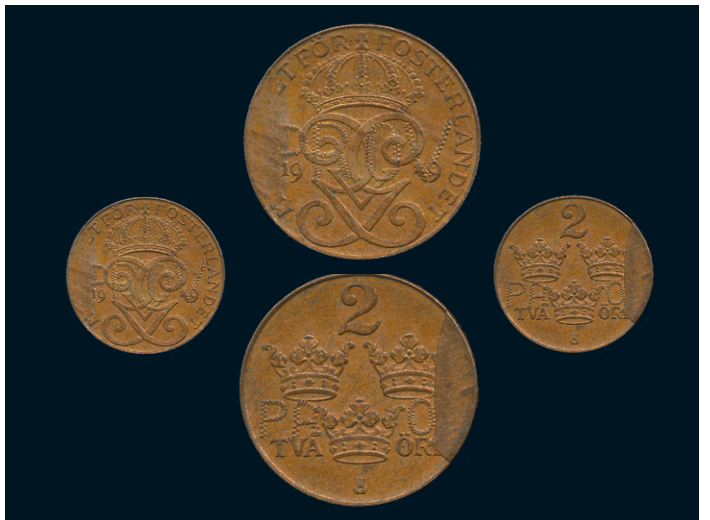
929 * Gustav V. 2 öre 1949. Provmynt i brons med PROV på åt- och frånsida. SM -. SMF -. 4,06 g. XR. 01 plantsfel. 4.000 930 Omfattande årtalssamling O II-C XVI G i 4 album inkl flera bättre-bra ex av bl a 2 kr 1898, 1 kr 1901, 50 öre 1875, 25 öre 1883 och 10 öre 1887 samt även bättre årtal som 50 öre 1877, 25 öre 1878, 10 öre 1875, 5 öre 1910 och 1927. Besiktiga. 6.000