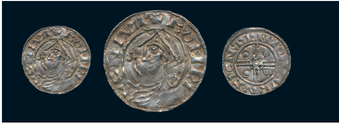
870 * Skandinavien. Imitation av Knut den Stores penning av Pointed Helmet-typ, präglad med tidigare okända stamplar som inte ingår i nu kända stampkedjor. 1,16 g. 1/1+ varit böjd. 3.000