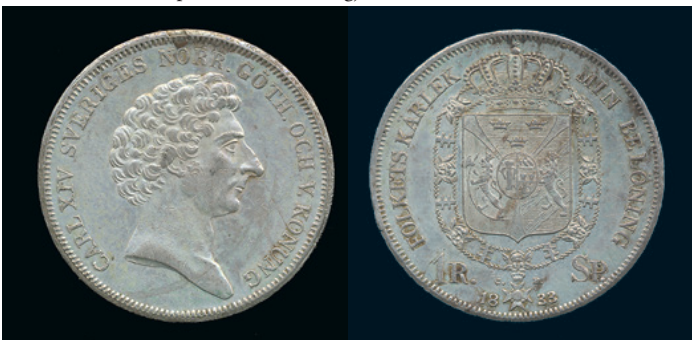
1016 * Karl XIV Johan. Riksdaler specie 1833/1. SM 61b. 1+/01 plantsfel, rispor. 1.000