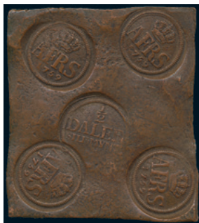
1002 * Adolf Fredrik. 1/2 daler SM 1759. SM 156. 1/1+ något korroderad. 2.000