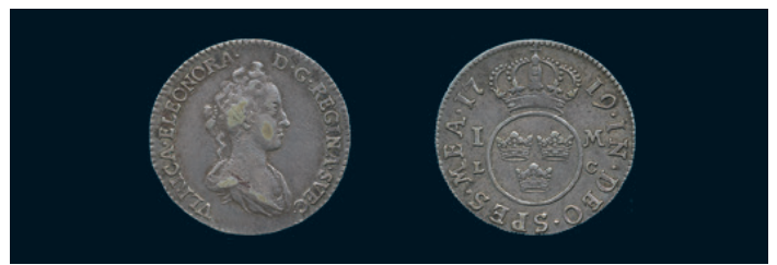
991 * Ulrika Eleonora. Mark 1719. SM 7. 1/1+ något korroderad på åtsidan. 1.000