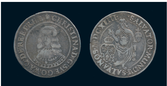
975 * Kristina. 1/2 riksdaler 1647. SM 32. 1 repa, "uppgraverad". 1.000