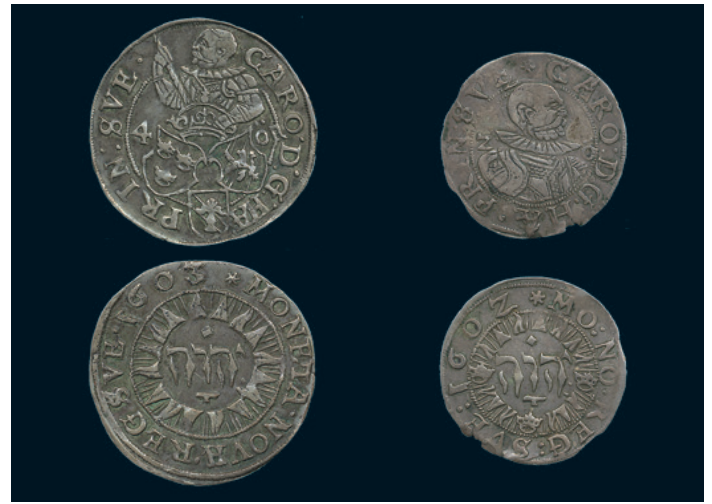
966 * Karl (IX) Riksföreståndare. 4 öre 1603. SM 19. 1/1+ liten inristning. 3.500