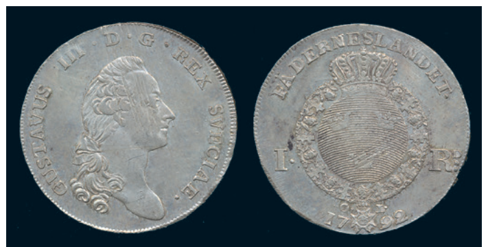
1010 * Gustav III. Riksdaler 1792. SM 54. 1+/01(1+) plantsrispor. 800