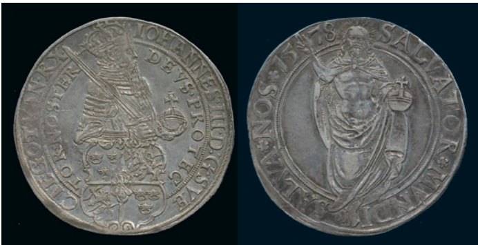
964 * Johan III. Daler 1578. SM 27. Bra ex 1+. 6.000