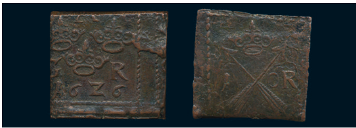
972 * Gustav II Adolf. Öre (klipping) 1626. SM 126. 1+)(1/1+ korroderad. 600