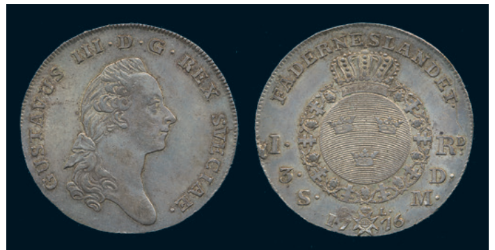
1004 * Gustav III. Riksdaler 1776. SM 43. 1+ repa. 600