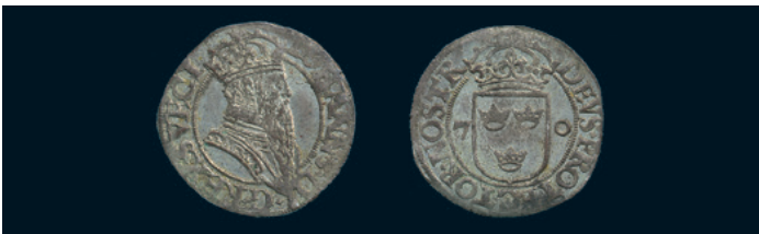
965 * Johan III. 2 öre 1570. SM 62. 01. 1.000