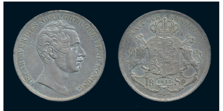
1022 * Oskar I. Riksdaler specie 1844. SM 24. 1/1+ lätt rengjord. 700