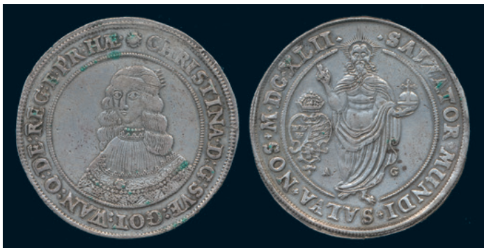
974 * Kristina. Riksdaler 1642. SM 14a. Rengjort ex 1+ repor och små ärgfläckar. 1.500