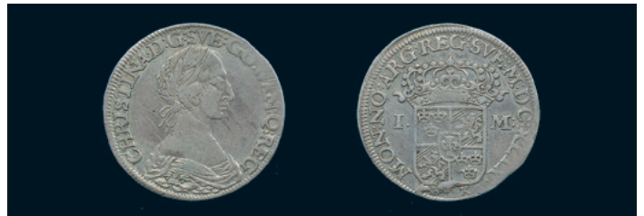
978 * Kristina. Mark 1649. SM 76. 1/1+ kantex. 1.000