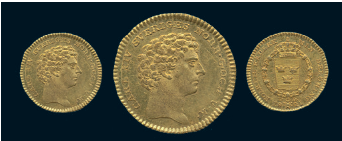
1013 * Karl XIV Johan. Dukat 1821. SM 16. 3,46 g. 1+/01 rispor. 8.000