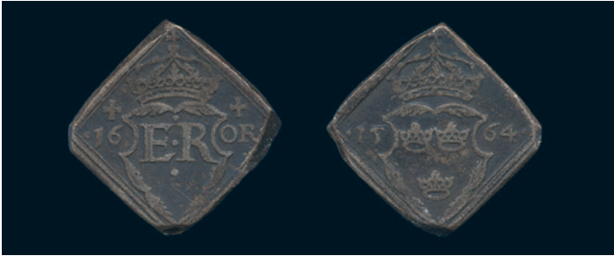
962 * Erik XIV. 16 öre (klipping) 1564. SM 45. Något korroderat ex 1/1+ med mörk patina. 800