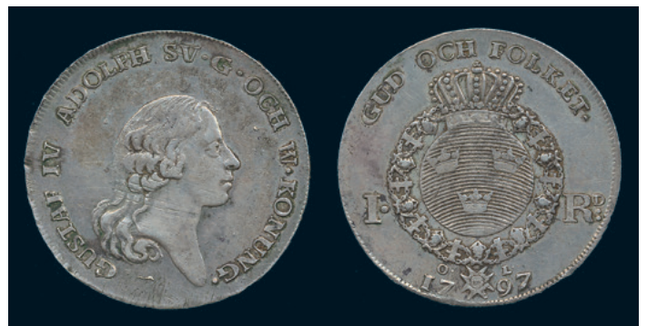
1011 * Gustav IV Adolf. Riksdaler 1797. SM 26. 1/1+ rispa. 800