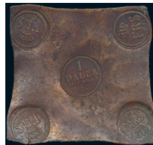
996 * Fredrik I. Daler SM 1731. SM 252. 1/1+ ärg. 2.000