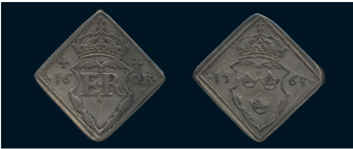
961 * Erik XIV. 16 öre (klipping) 1563 med stjärnor mellan bokstäverna. SM 44c. R. 1/1+. 2.000