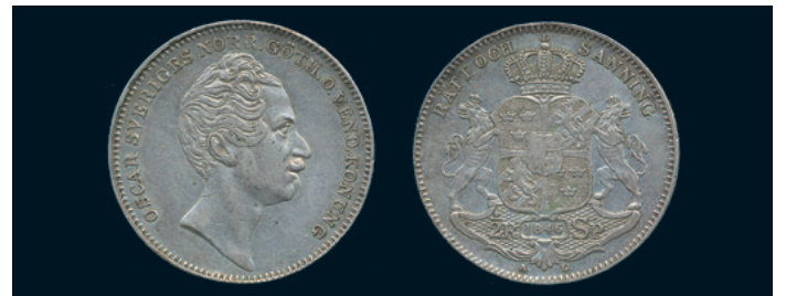
1023 * Oskar I. 1/2 riksdaler specie 1846/5. SM 37b. 1/1+ obet kanthack. 500