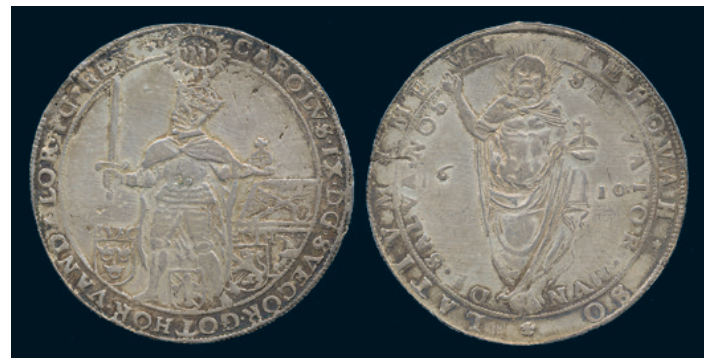
968 * Karl IX. Riksdaler 1610 med MEVM. SM 23a. 1/1+ varit hängd, lätt uppgraverad. 2.500