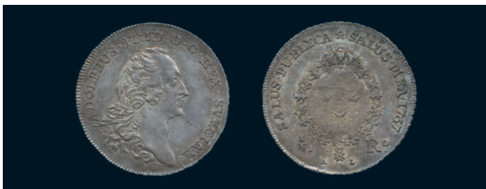
1001 * Adolf Fredrik. 1/4 riksdaler 1767. SM 74. 1+. 1.200