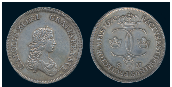
982 * Karl XI. 8 mark 1670. SM 59a. Typmynt. Tilltalande ex 1+ obet kanthack. 6.000