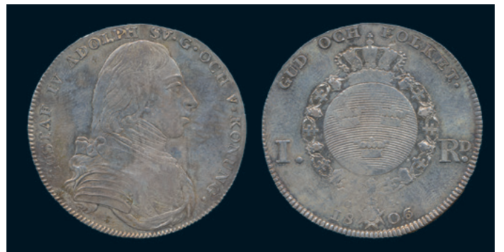
1012 * Gustav IV Adolf. Riksdaler 1806. SM 29. Rengjort, delvis svagt utpräglat ex 1/1+ obet plantsrispor. 800