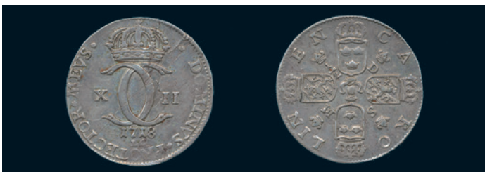
988 * Karl XII. Carolin / 1/2 daler SM 1718. SM 144. Typmynt. Tilltalande ex 1/1+ plantsfel, små repor. 800