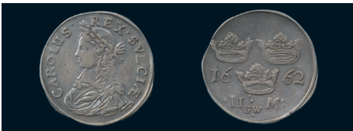
984 * Karl XI. 2 mark 1662. SM 90. Tilltalande ex 1/1+. 800 985 Karl XI. Pommern, Stettin. 1/3 taler 1673. SB 125c. 2 ex med varierande stil. 600