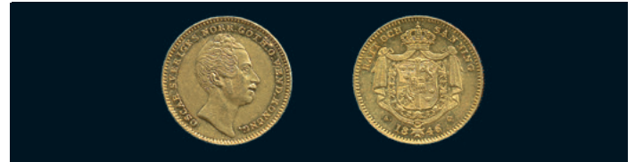
1021 * Oskar I. Dukat 1846/4. SM 10. 1/1+)(1+. 2.000