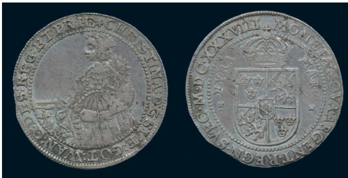
976 * Kristina. 4 mark 1638 med stor krage. SM 42b. Typmynt. 1/1+ troligen varit infattad. 2.000