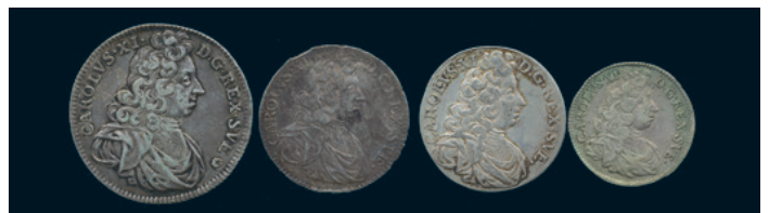
983 * Karl XI. 4 mark 1694/3 varit hängd, 2 mark 1689 och 1695 samt Mark 1693. 1/1+. 1.200