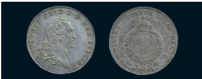
1000 * Adolf Fredrik. Daler SM 1770, 31 mm. SM 68a. Typmynt. 1+. 1.200