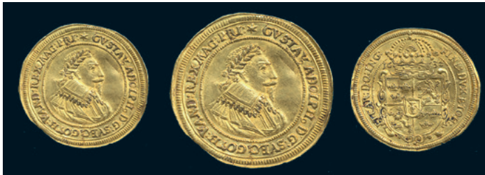
973 * Gustav II Adolf. Nürnberg. Dukat 1632. 3,42 g. SB 4. Typmynt. 1+ något bucklig. 4.000