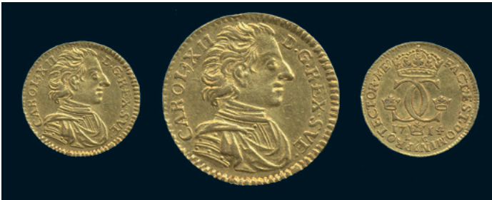
986 * Karl XII. Dukat 1714. SM 16. 3,45 g. 1+ varit böjd, varit hängd. 8.000