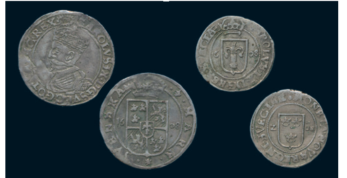
969 * Karl IX. 1/2 mark 1608. SM 61. 1/1+ ojämn plants. 800