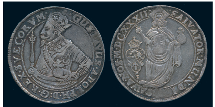
971 * Gustav II Adolf. Riksdaler 1632 med felvänt vapen. SM 32b. 1/1+ varit rengjord. 2.500