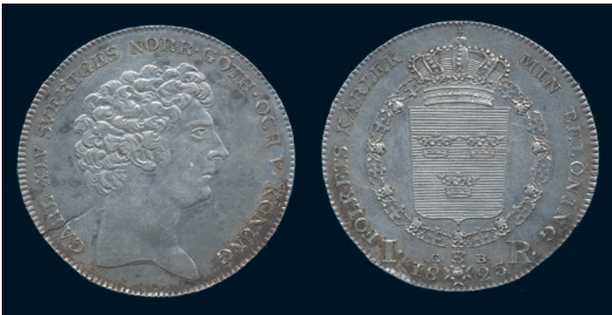
1015 * Karl XIV Johan. Riksdaler 1825. SM 47. 1+ plantsfel, varit rengjord. 1.700