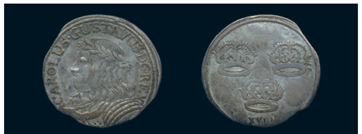
981 * Karl X Gustav. Thorn. 18 groschen utan år (1656). SB 1. Typmynt. 1/1+ kantex, gniden. 700