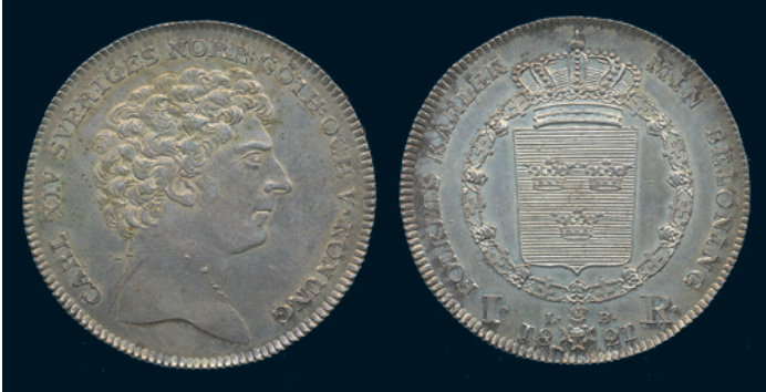
1014 * Karl XIV Johan. Riksdaler 1821. SM 42. Tilltalande ex 1+/01(01). 2.500