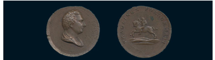
1020 * Karl XIV Johan. Provmynt. 2/3 skilling banco 1844. SM 212. 4,72 g, tunn platt. Ex Ekström VII nr 271. RR. 1 korroderad. 1.000