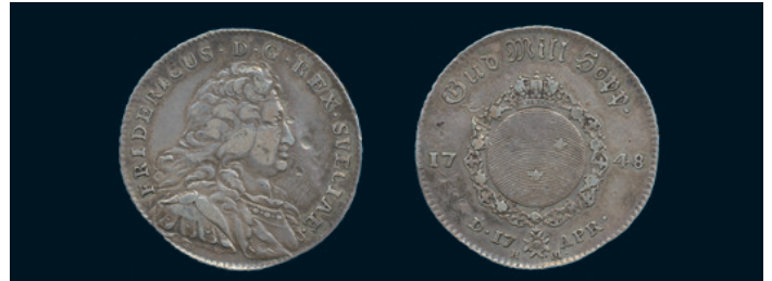
993 * Fredrik I. 1/4 riksdaler 1748. SM 105a. Typmynt. 1/1+ hack, varit böjd. 500