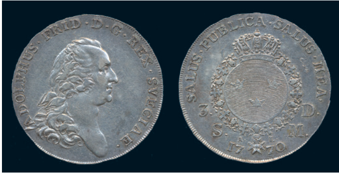
999 * Adolf Fredrik. Riksdaler 1770. SM 59. 1+ varit rengjord, repa. 1.000