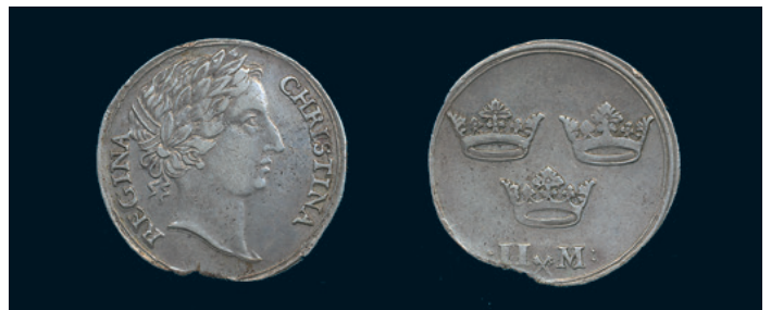
977 * Kristina. 2 mark utan år. SM 63b. 1/1+ kanthack, kantex. 600