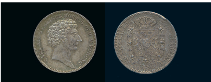
1018 * Karl XIV Johan. 1/3 riksdaler 1828 med randskrift. SM 53a. 1+ med fin bottenlyster på åtsidan. 800