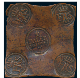
997 * Fredrik I. 1/2 daler SM 1722. SM 274. Jämn mellanbrun patina 1/1+. 2.000