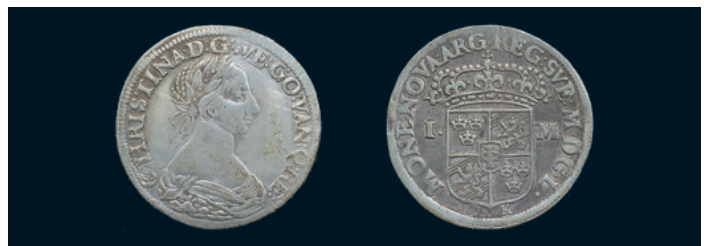
979 * Kristina. Mark 1650. SM 77. 1/1+. 800 980 Kristina. Stralsund. 1/16 taler 1648. SB 25. R. Något böjd 1/1+. 300