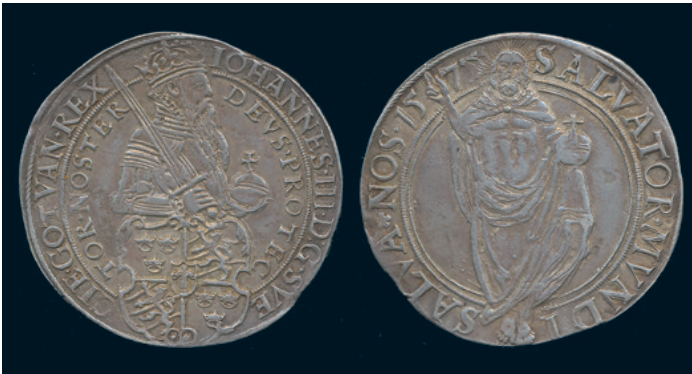
963 * Johan III. Daler 1575. SM 25. 1/1+ plantsfel. 4.000