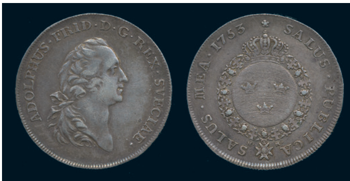
998 * Adolf Fredrik. Riksdaler 1753. SM 43. 1/1+ repa. 1.500