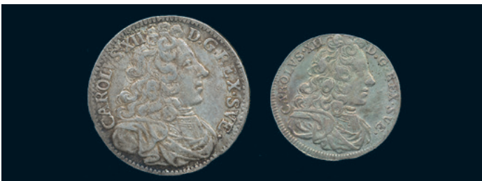
987 * Karl XII. 2 mark 1701 och Mark 1704. SM 62, 86. 1/1+. 800