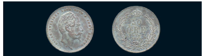
1024 * Oskar I. 50 öre 1857. SM 61. Typmynt. Bra ex 1+/01. 500