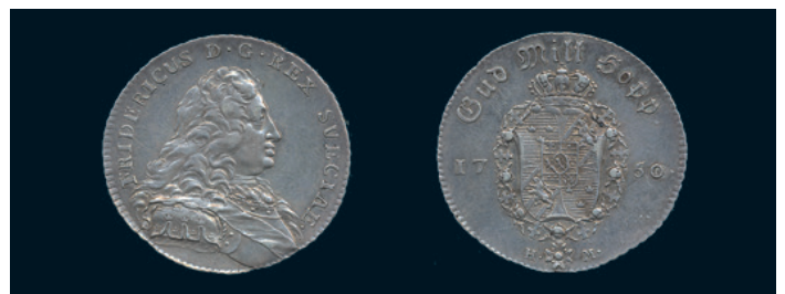
994 * Fredrik I. 1/4 riksdaler 1750. SM 106. Typmynt. 1/1+ varit rengjord. 900