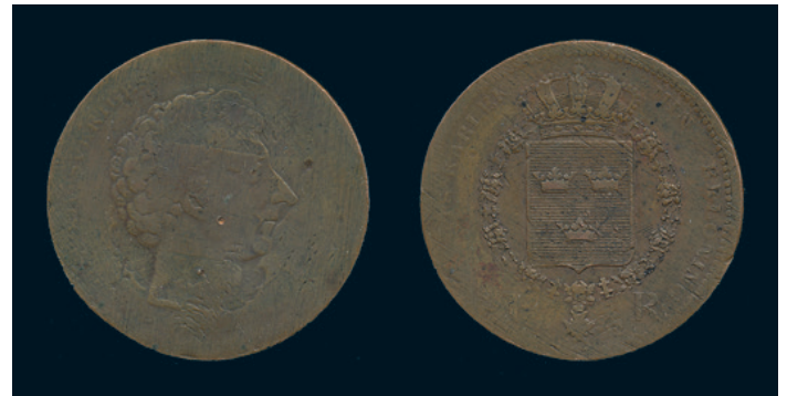
1019 * Karl XIV Johan. Provmynt. Riksdaler (specie) 1822 i koppar. SM 195b. 27,82 g. Präglad 2 gånger. RRR. Ex Sven Svensson, SNF auktion 140 november 2000 nr 116. 1/2 hack. 2.000