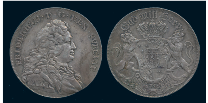
992 * Fredrik I. Riksdaler 1746. SM 86. 1+ repa. 2.000